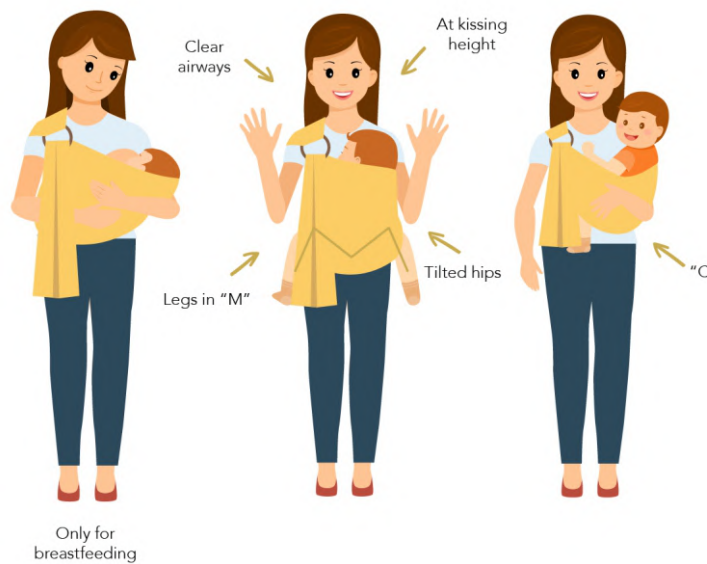
Only for breastfeeding